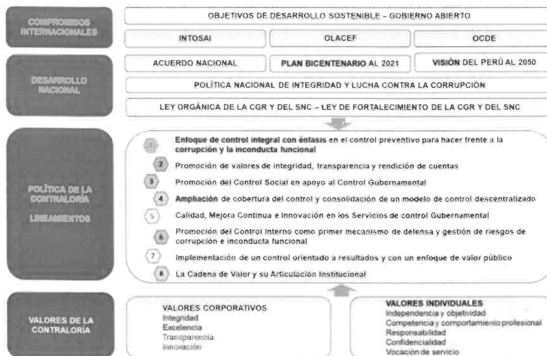
Figura N° 1 Marco General de la Política Institucional

Elaboración: Gerencia de Modernización y Planeamiento