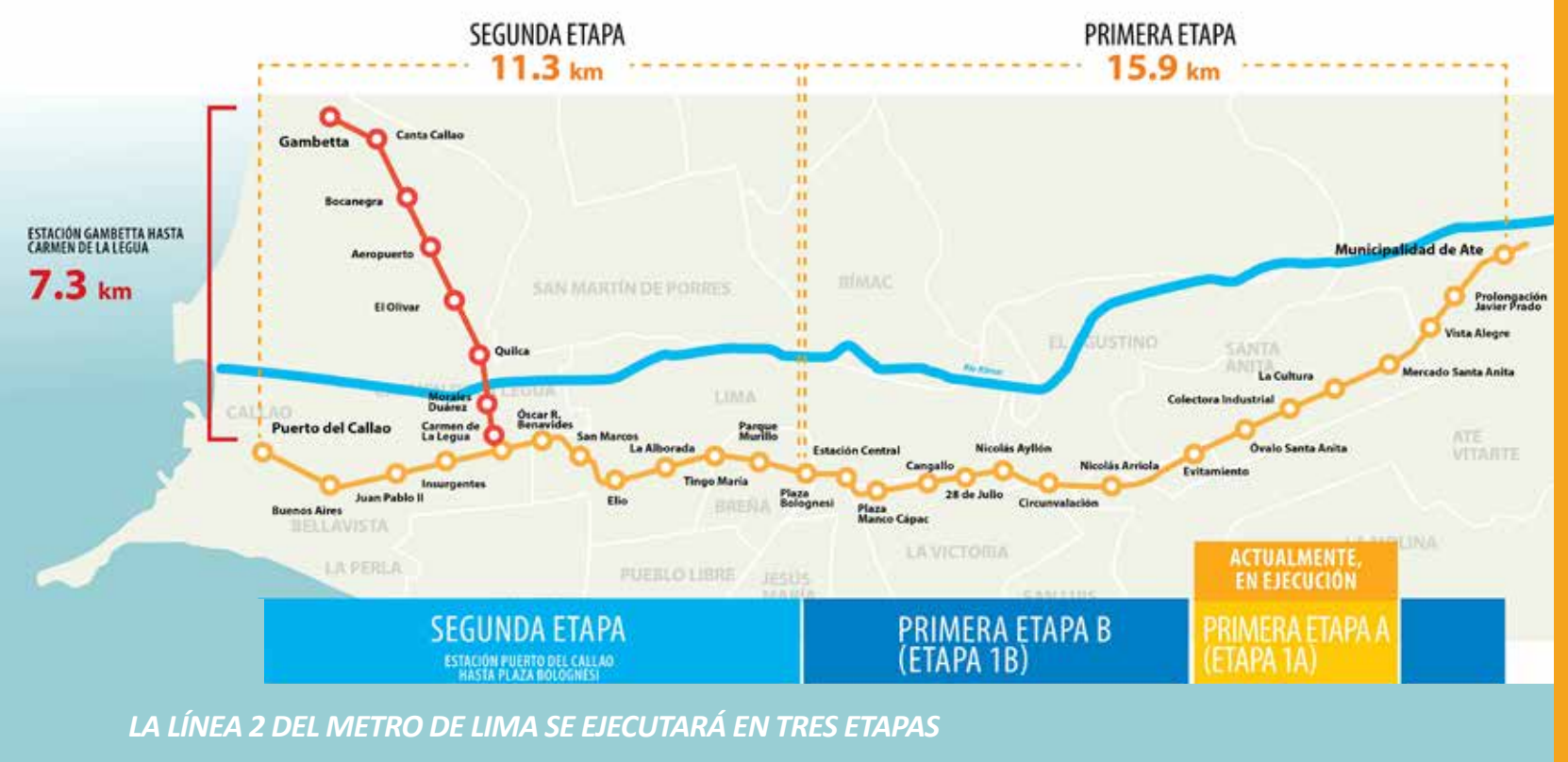
LA LÍNEA 2 DEL METRO DE LIMA SE EJECUTARÁ EN TRES ETAPAS

SE HA RETRASADO LA EJECUCIÓN DE LA OBRA Y EXISTE EL RIESGO DE QUE SE INCREMENTEN LOS COSTOS DEL PROYECTO