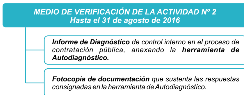
Figura N° 4: Medios de verificación de la Actividad N° 2

En caso la municipalidad no cuente con un OCI, el Presidente del CCI de la Municipalidad deberá remitir la documentación mediante oficio al Departamento de Control Interno de la Contraloría General de la República CGR, ubicado en el Jr. Camilo Carrillo 114, Jesús María - Lima.