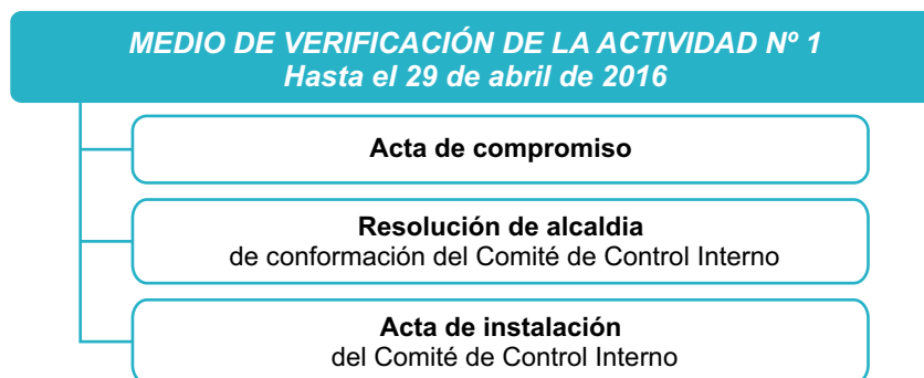
Figura N° 1: Medios de verificación de la Actividad N° 1

En caso la municipalidad no cuente con OCI, el oficio deberá ser remitido al Departamento de Control Interno de la Contraloría General de la República (CGR), ubicado en el Jr. Camilo Carrillo 114, Jesús María – Lima.