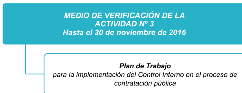
Figura N° 6: Medio de verificación de la Actividad N° 3

En caso la municipalidad no cuente con un OCI, el Presidente del CCI de la municipalidad deberá remitir la documentación mediante oficio al Departamento de Control Interno de la Contraloría General de la República (CGR), ubicado en el Jr. Camilo Carrillo 114, Jesús María - Lima.